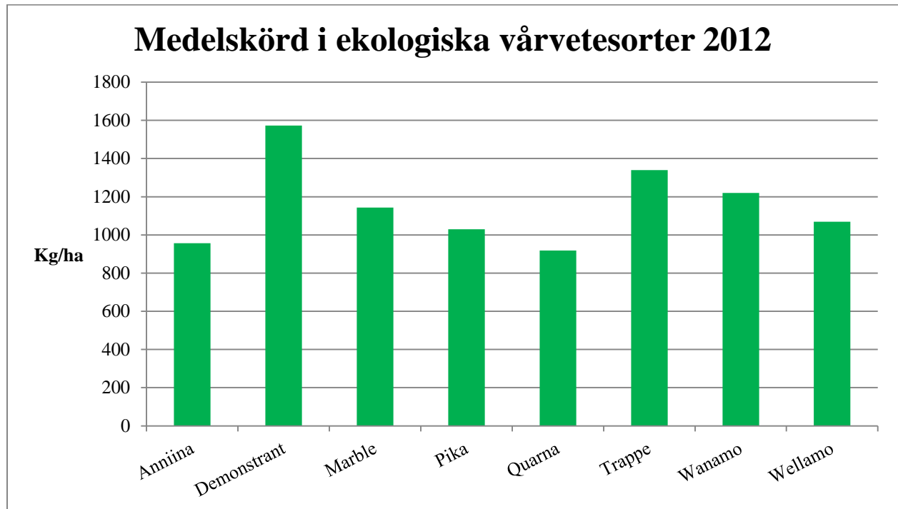
Bild . Vårvete